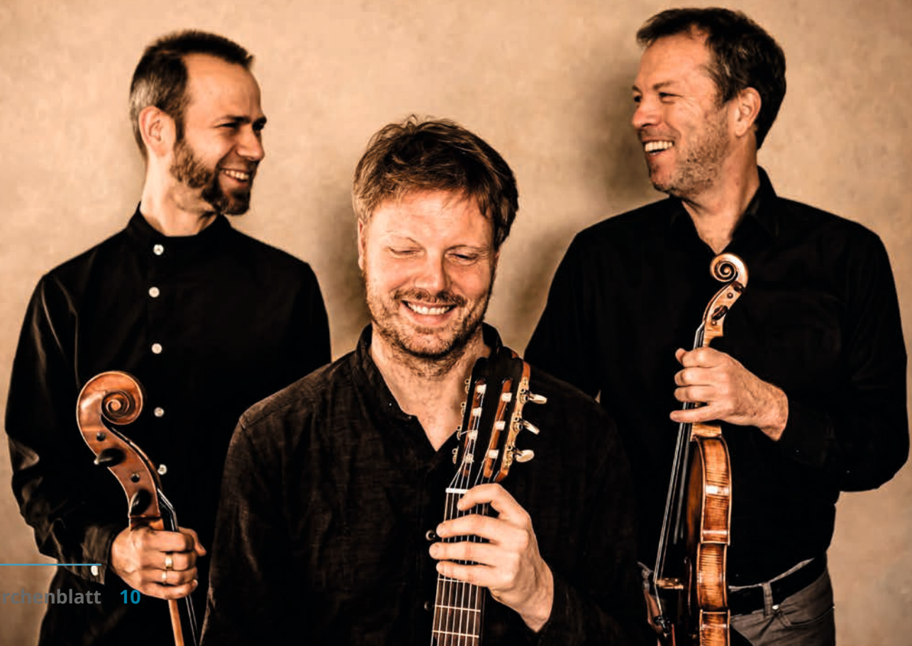
Malte Viefs Kammer