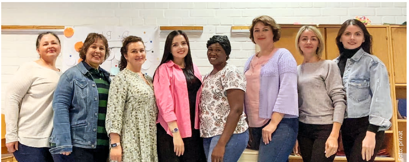
Ein Teil der Sängerinnen von FreedomVoice